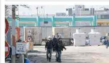
24/02/2012 Rovigo, antennista precipita da 15 metri e muore