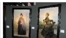
24/02/2012 Rovigo, su il sipario sul Divisionismo a Palazzo Roverella